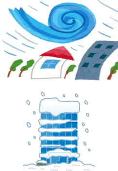
風・雹・雪災、水災による損害共済金の推移

平成26年豪雪による雪災、平成30年7月豪雨による水災、平成30年台風21号及び台風24号による風災といった様々な自然災害が発生し、共済金の支払いが増加していることから、共済掛金率を改定しました。